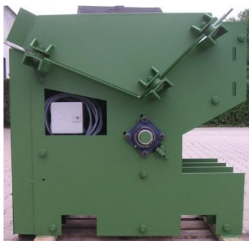
Varianten nach Kundenwunsch